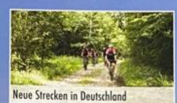
Neue Strecken in Deutschland