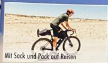
Mit Sack und Pack auf Reisen